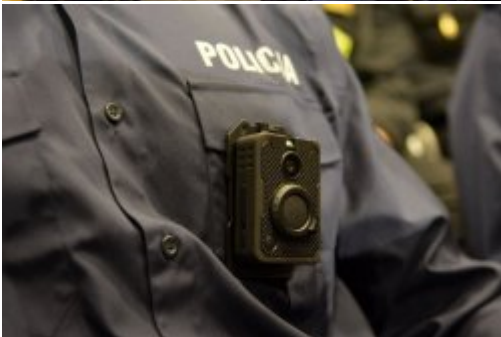
Podsumowanie dwóch lat pracy MSWiA #8