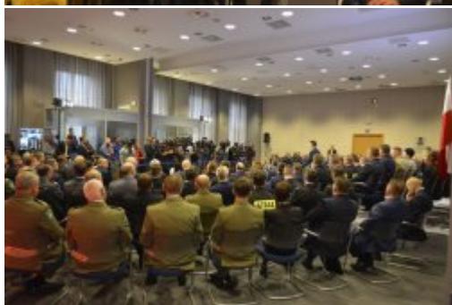
Podsumowanie dwóch lat pracy MSWiA #5