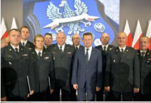
Podsumowanie dwóch lat pracy MSWiA #11