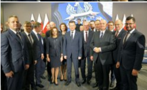
Podsumowanie dwóch lat pracy MSWiA #10