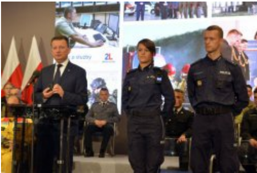
Podsumowanie dwóch lat pracy MSWiA #6