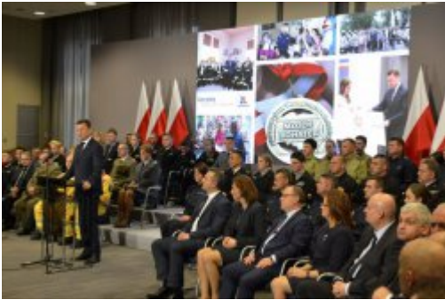
Podsumowanie dwóch lat pracy MSWiA #3