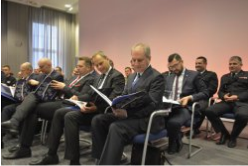
Podsumowanie dwóch lat pracy MSWiA #12