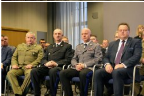
Podsumowanie dwóch lat pracy MSWiA #1