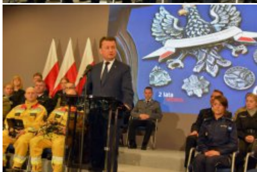
Podsumowanie dwóch lat pracy MSWiA #7