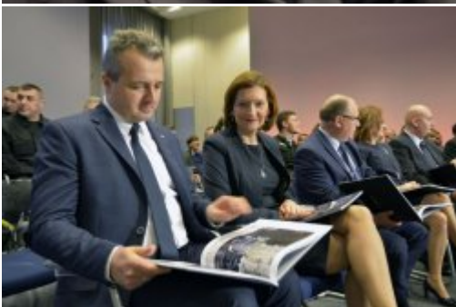
Podsumowanie dwóch lat pracy MSWiA #9