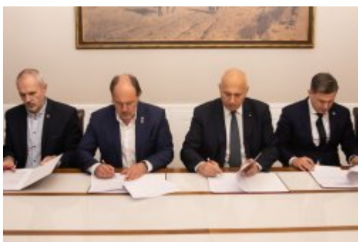
Jest porozumienie MSWiA i związków zawodowych funkcjonariuszy

W kwestii postulatu związanego z artykułem 15a ustawy o zaopatrzeniu emerytalnym funkcjonariuszy strony ustaliły, że pozostają przy rozbieżnych stanowiskach, jednak deklarują wolę rozwiązania problemu do końca 2019 r. Chodzi tu o zasady przejścia na emeryturę dla funkcjonariuszy przyjętych do służby w okresie po 1 stycznia 1999 r. i przed 1 października 2003 r.