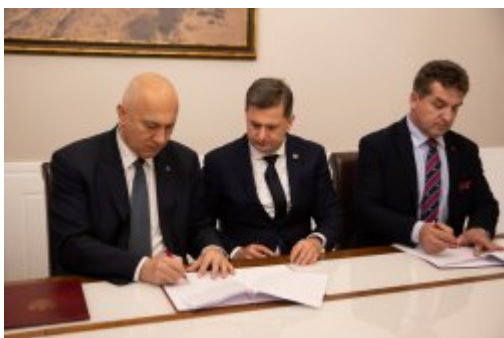
Jest porozumienie MSWiA i związków zawodowych funkcjonariuszy