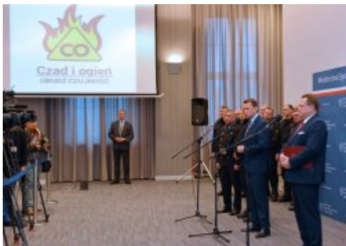
Czad i ogień