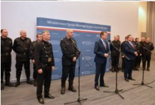
Czad i ogień