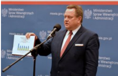
Czad i ogień