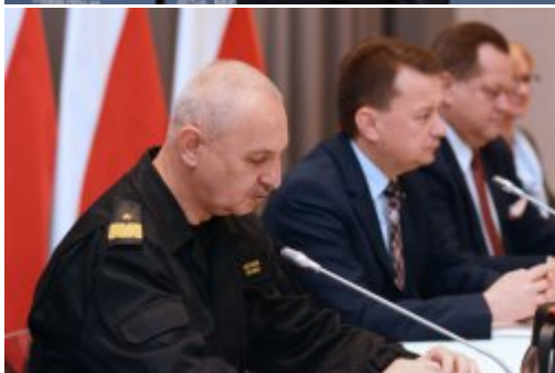
Czad i ogień