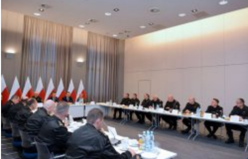
Czad i ogień