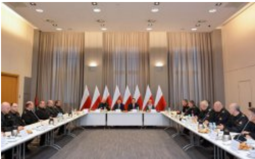
Czad i ogień