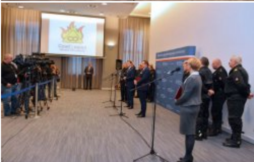
Czad i ogień