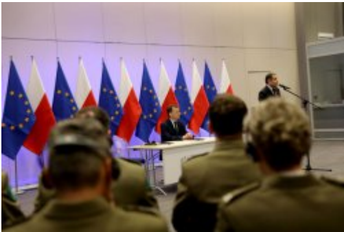
Podpisanie umowy z FRONTEXEM