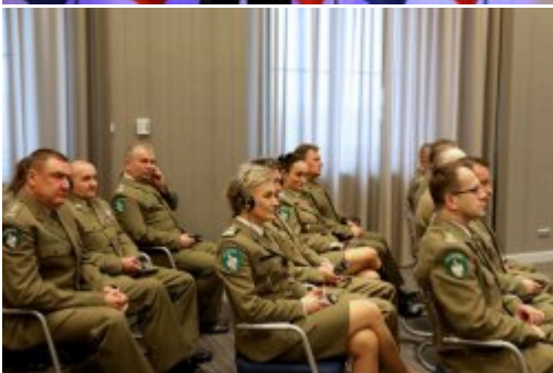
Podpisanie umowy z FRONTEXEM