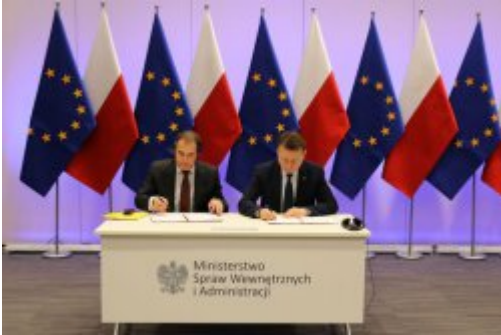
Podpisanie umowy z FRONTEXEM