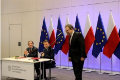
Podpisanie umowy z FRONTEXEM