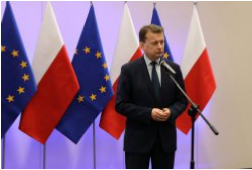
Podpisanie umowy z FRONTEXEM