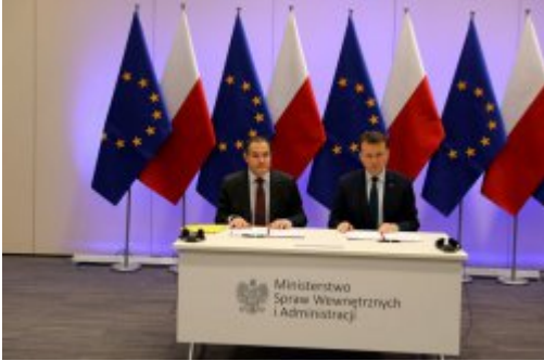
Podpisanie umowy z FRONTEXEM