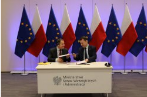
Podpisanie umowy z FRONTEXEM