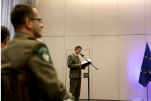
Podpisanie umowy z FRONTEXEM