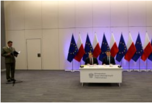
Podpisanie umowy z FRONTEXEM