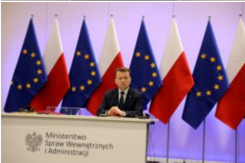
Podpisanie umowy z FRONTEXEM