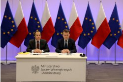
Podpisanie umowy z FRONTEXEM