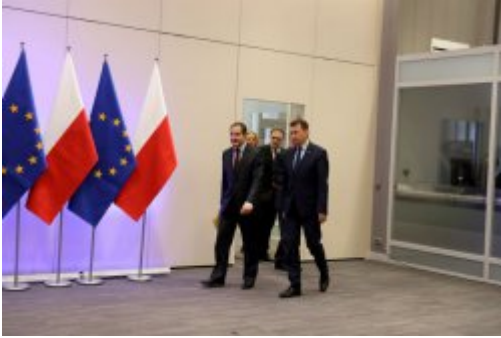
Podpisanie umowy z FRONTEXEM