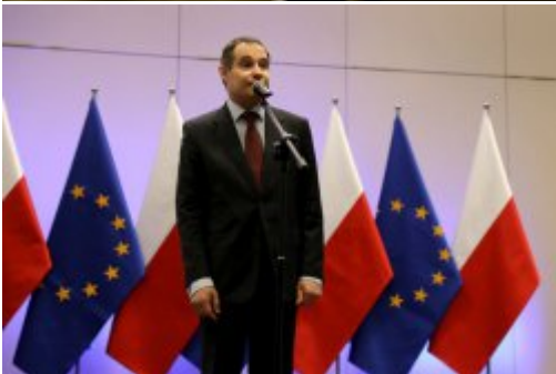
Podpisanie umowy z FRONTEXEM