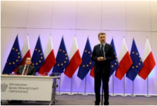
Podpisanie umowy z FRONTEXEM