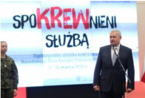
Inauguracja akcji "SpoKREWnieni Służbą"