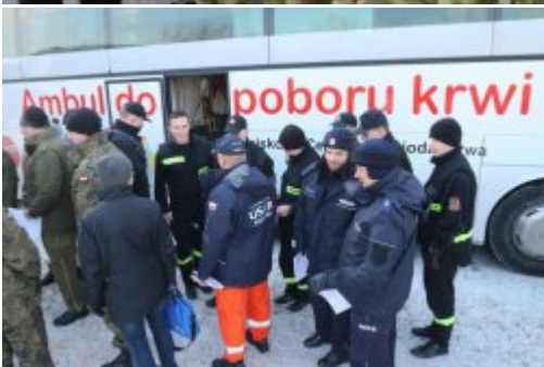
Inauguracja akcji "SpoKREWnieni Służbą"