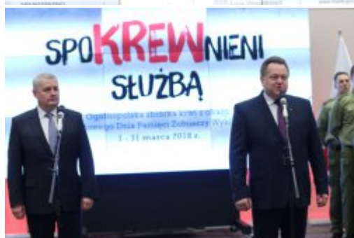
Inauguracja akcji "SpoKREWnieni Służbą"