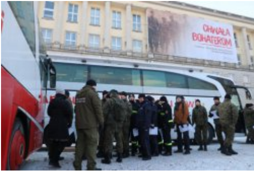
Inauguracja akcji "SpoKREWnieni Służbą"