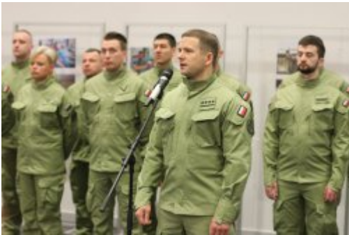
Inauguracja akcji "SpoKREWnieni Służbą"