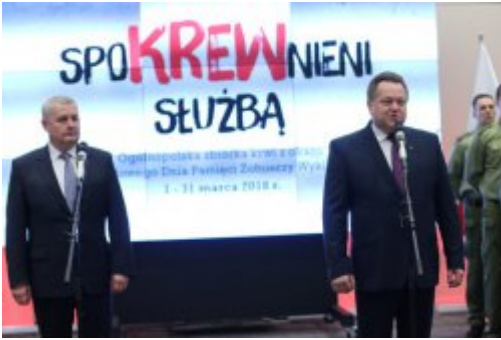
Inauguracja akcji "SpoKREWnieni Służbą"