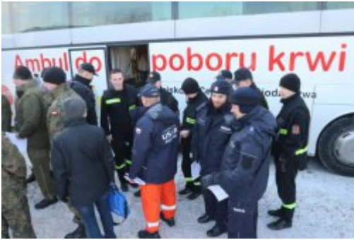
Inauguracja akcji "SpoKREWnieni Służbą"