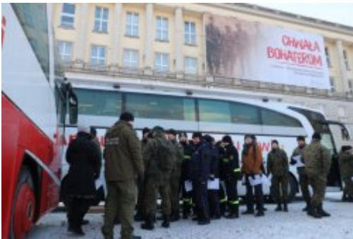
Inauguracja akcji "SpoKREWnieni Służbą"