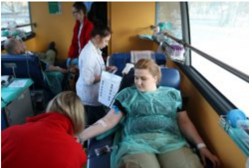
Inauguracja akcji "SpoKREWnieni Służbą"