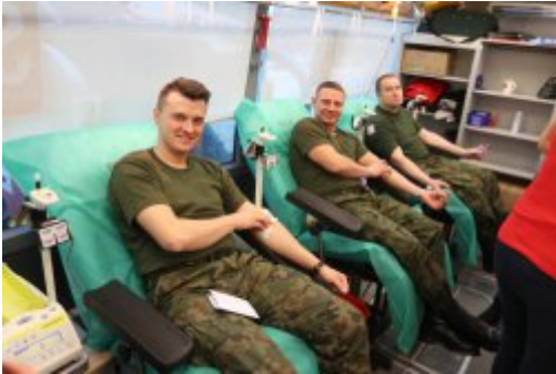
Inauguracja akcji "SpoKREWnieni Służbą"