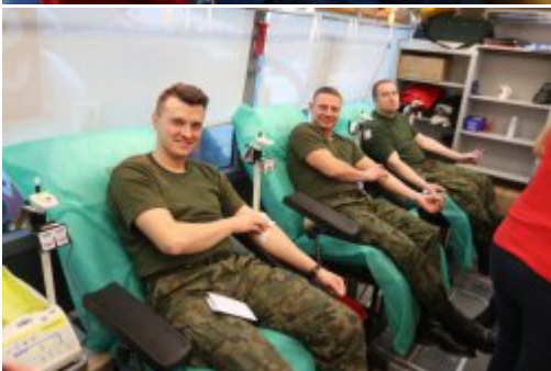
Inauguracja akcji "SpoKREWnieni Służbą"