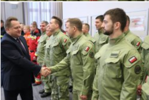
Inauguracja akcji "SpoKREWnieni Służbą"