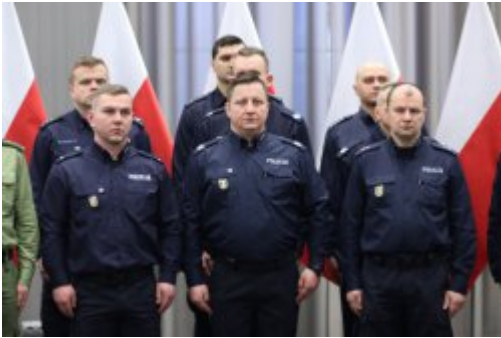
Inauguracja akcji "SpoKREWnieni Służbą"