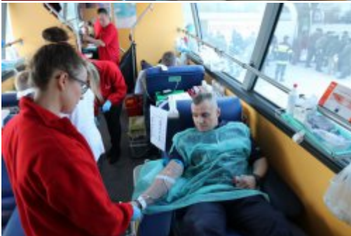
Inauguracja akcji "SpoKREWnieni Służbą"