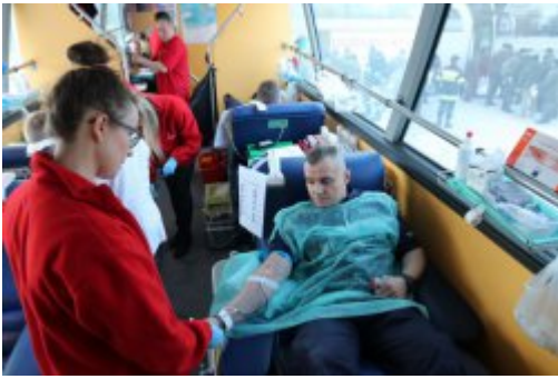
Inauguracja akcji "SpoKREWnieni Służbą"