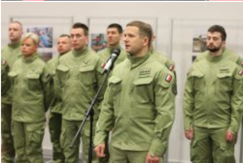
Inauguracja akcji "SpoKREWnieni Służbą"